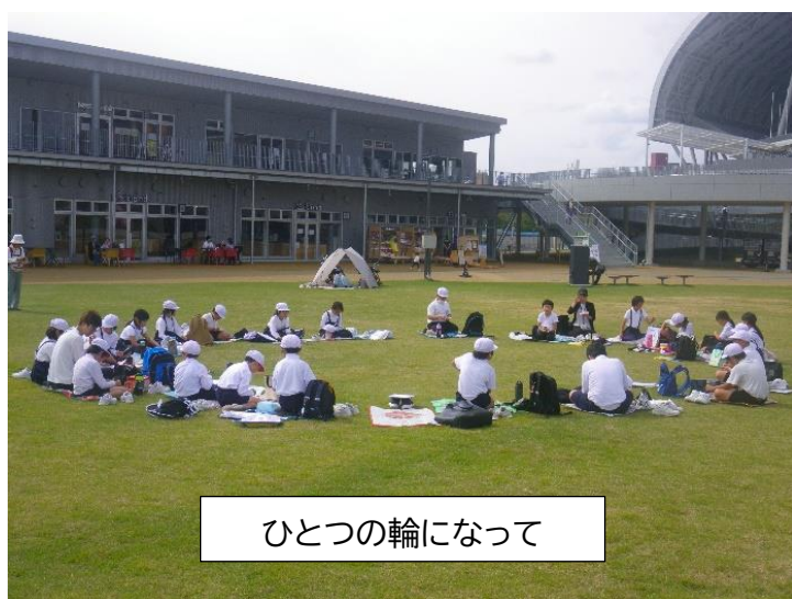
ひとつの輪になって